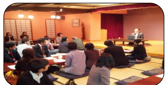
若手職員を対象とした座談会