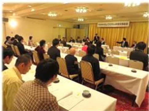
●秋田支部総会の様子