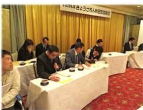
●利用者部会の様子